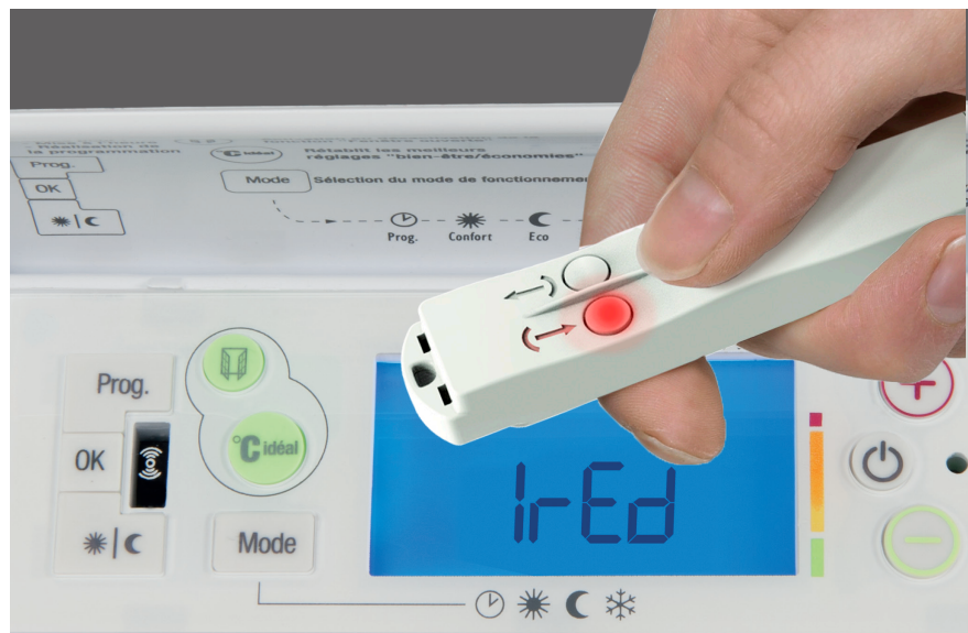
Transfert et duplication d'un appareil à l'autre grâce à la clé infrarouge.