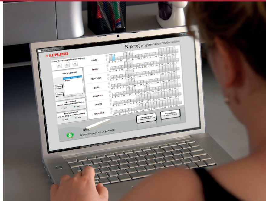
Programmation sur simple et rapide sur application PC