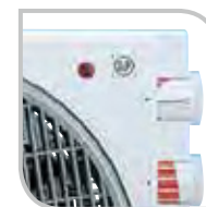
Boutons de sélection Vitesse/Thermostat

METEOR NT : Ventilateur type Box Fan, donnant un débit d'air élevé tout en conservant un fonctionnement très silencieux. Il dispose de 3 vitesses de ventilation et d'une grille de diffusion d'air. La grille de diffusion est soit fixe soit en rotation continue sur 360°. Pour optimiser la diffusion d'air, il est possible d'incliner le ventilateur suivant 5 positions différentes par rapport au pied support. Le ventilateur, en plus de sa position au sol standard, peut être fixé au mur ou au plafond. Il est équipé d'une grille de protection arrière, d'un système pour enrouler le câble et d'une poignée de transport.