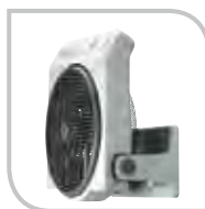
Installation en paroi