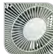
Grille de protection arrière